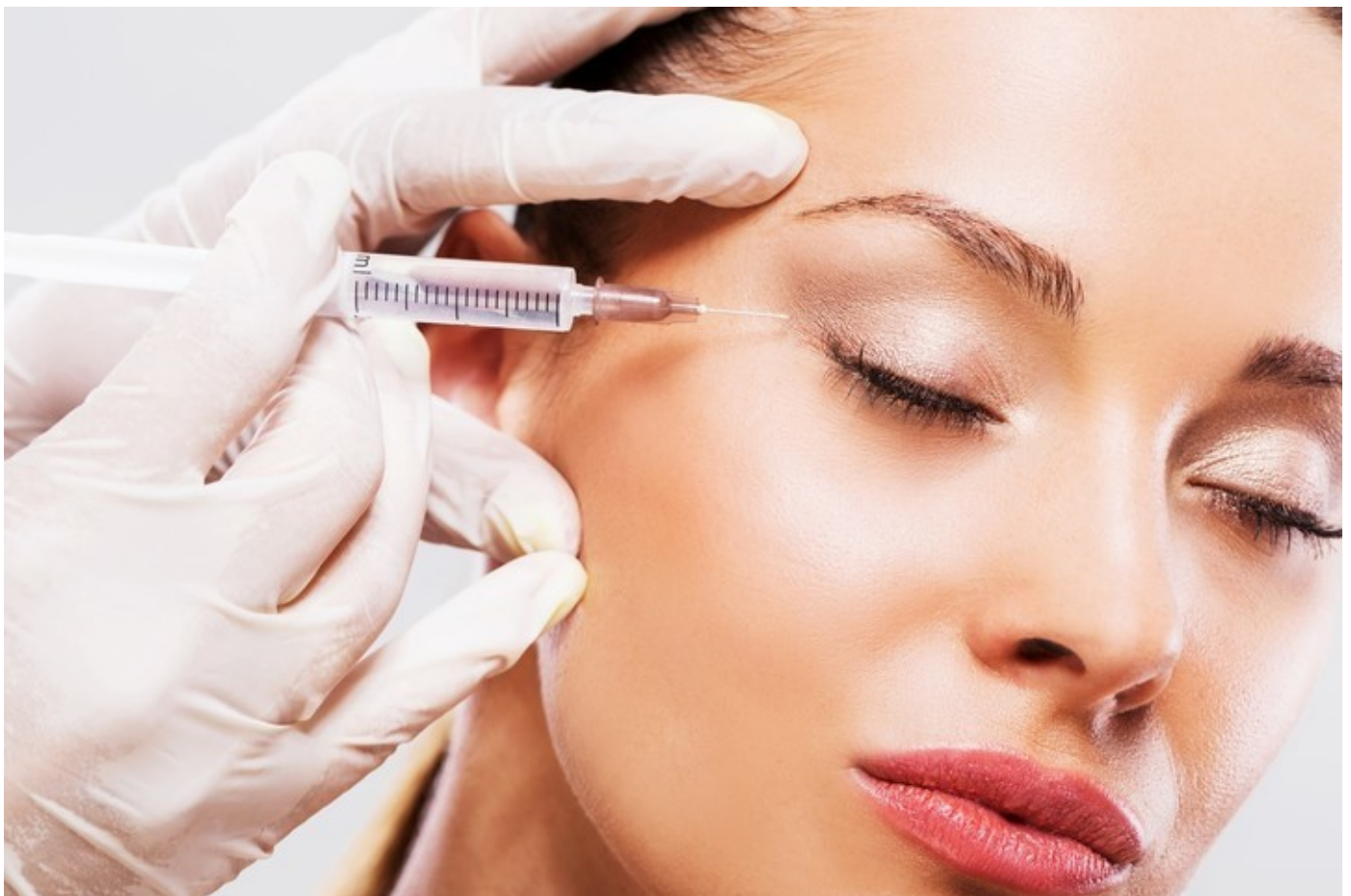
El bótox es el tratamiento estético más requerido.