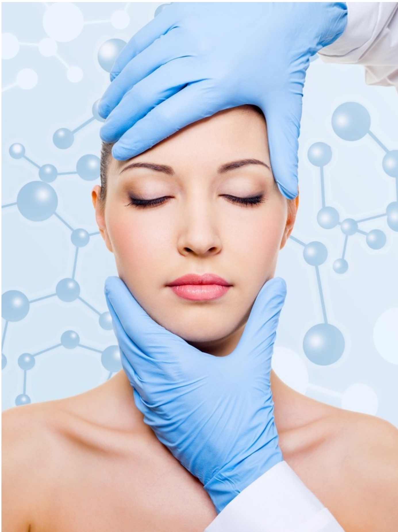
Bótox: ideal para tratar las arrugas de expresión.