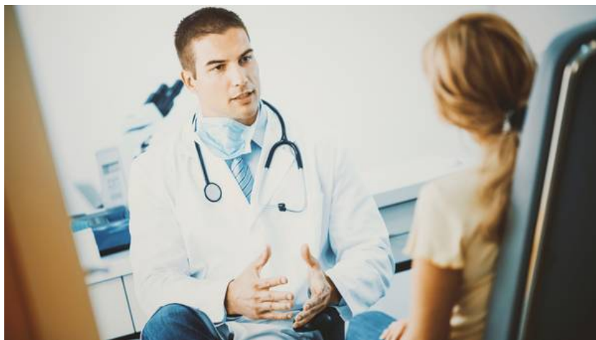
Nunca se debe realizar un procedimiento quirúrgico fuera de una clínica, sanatorio u hospital.

Salud Situaciones ante las que un buen profesional debe negarse a realizar un procedimiento quirúrgico.